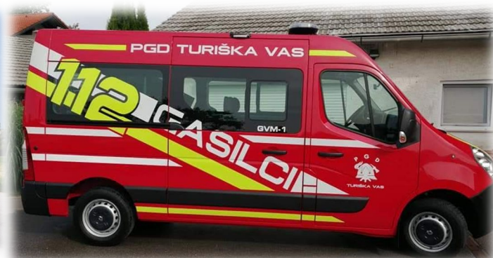
2019: GVM-1 Renault Master

Gasilsko vozilo s cisterno GVC-16/15 je vozilo z vgrajenim rezervoarjem za vodo, volumna 1500l, črpalko in gasilsko tehnično ter reševalno opremo. Gasilsko vozilo s cisterno GVC-16/15 se uporablja za gašenje in reševanje pri požarih ter za srednje zahtevne tehnične intervencije.