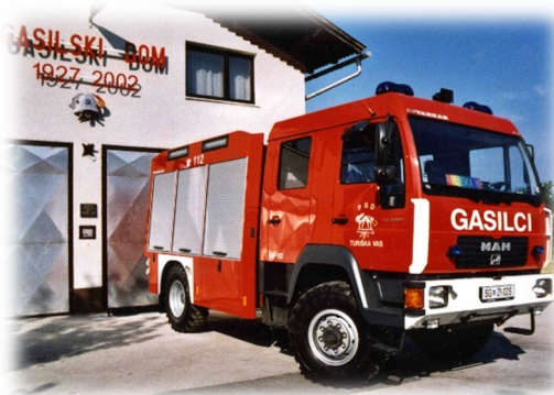
2002: GVC 16/15 MAN