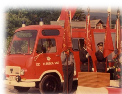
1984: orodno vozilo TAM 75-T