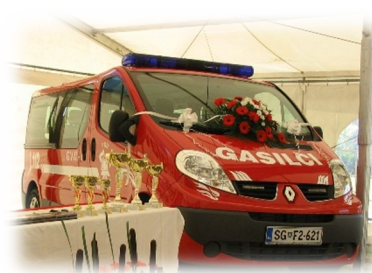
2008: vozilo za prevoz moštva