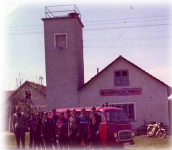
1968: orodno vozilo IMV