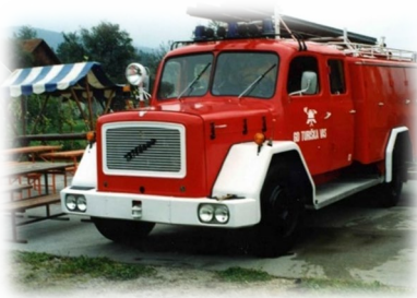
1991: avtocisterna »Ciza«