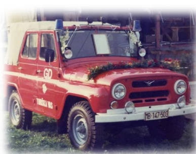
1977: terensko vozilo VAZ